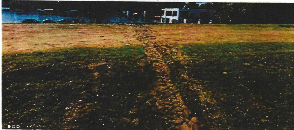
Слика 3. Траса рова кроз тело насипа по круни насипа