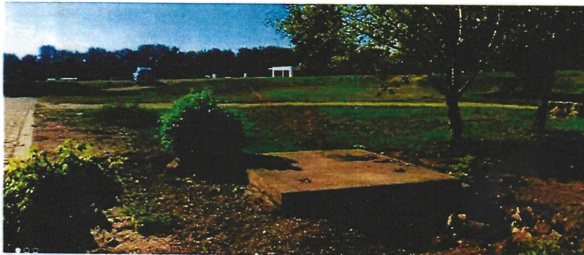
Слика 2. Траса рова у брањеном подручју и брањеној косини насипа